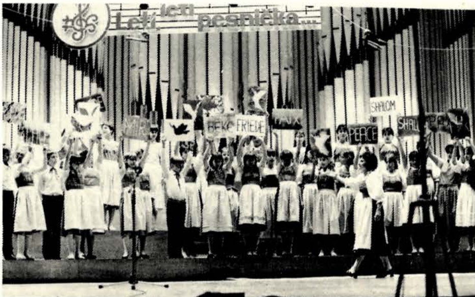
Záber z vystúpenia rakúskych detí na Medzinárodnom stretnutí detských rozhlasových zborov OIRT.