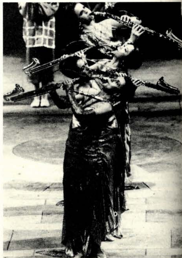
Scéna z hudobnodramatickeho cyklu Licht K. Stockhausena