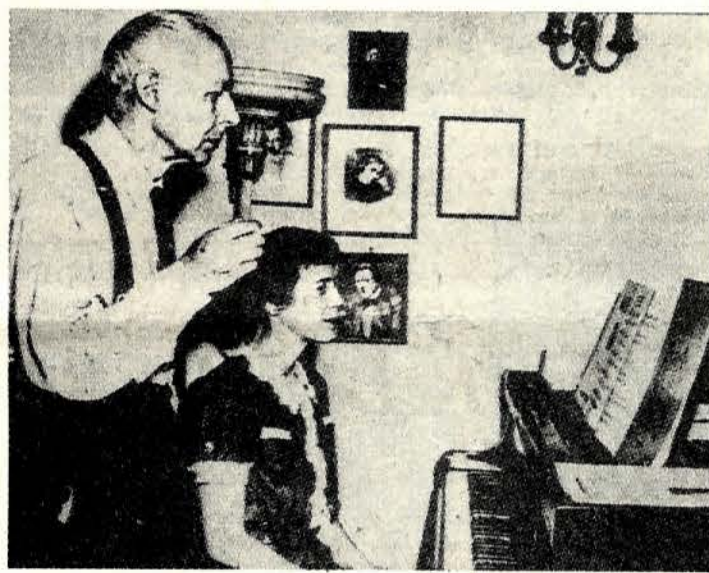
Bartók pri vyučovaní kompozície vo svojom newyorskom byte.