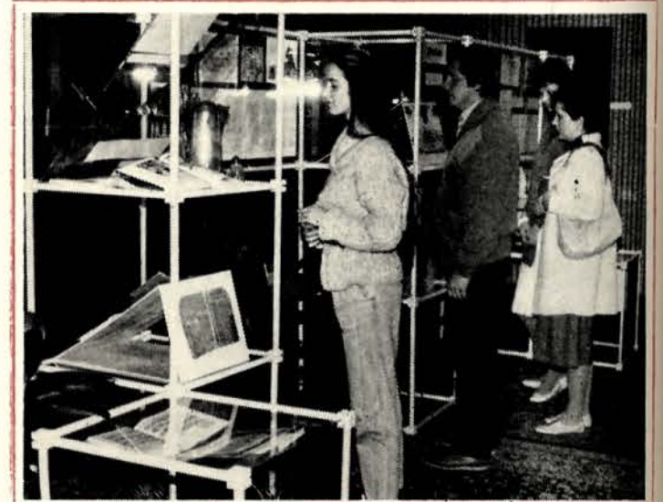
Pohľad na expozíciu Putovania D. Speera po Sariši a Zemlase Prešove.

Fragment Dpeerovho diela Philomela Angelika vydaného pod pseudonymom (anagramom) Res Plena Dei, zo zbierky hudobín v Pruskom, v súčasnosti v zb. Hudobného odd. SNM.