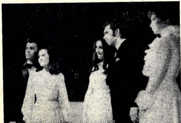
Z koncertného vystúpenia mladých moskovských umelcov.